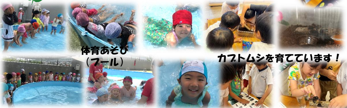
体育あそび (プール)

〇オクラ、ニンジン 4月の食べ物クイズから始まり、育てる野菜を決めみんなで大切に育ててきました。オクラは無事に5本収穫できました。トウモロコシ、ニンジンはもう少し収穫まで時間が必要なのですが、ニンジンが大きく育つために間引きをすると小さいニンジンが出できました。食べても大丈夫とのことでオクラと一緒にいただくことができました。枝豆はいつ収穫したらいいんだろうと観察しているうちに茶色になって食べることはできませんでした。ハブニングもたくさんあった活動でしたが4種類の野菜を育てることができ、食べ物に興味を持つきっかけになりました♡